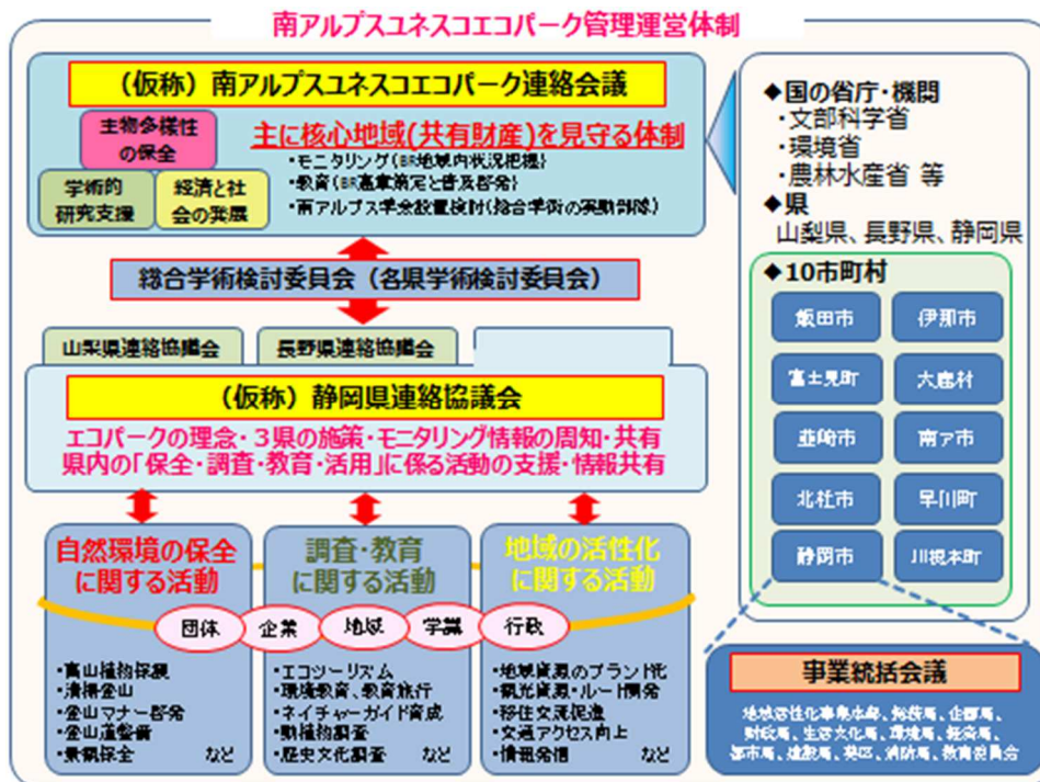
図 31 南アルプスユネスコエコパーク管理運営体制 (案)