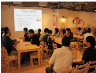
静岡庁舎3階の茶木魚に、市内学生及び国際こば学院の留学生約20名が集まりました。