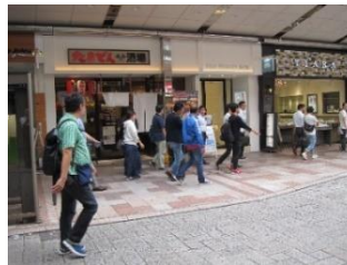
参加者は静岡の魅力を体感するため、3つのグループに分かれて、商店街の店舗を訪れました。