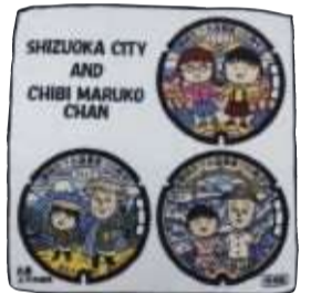
ミニタオルハンカチ