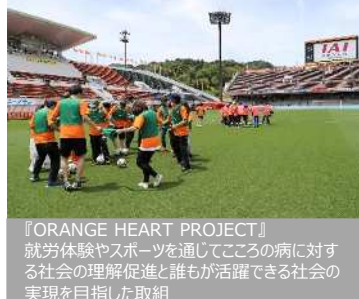
『ORANGE HEART PROJECT』 就労体験やスポーツを通じてこころの病に対する 社会の理解促進と誰もが活躍できる社会の 実現を目指した取組

これから先の未来、誰もが輝き続けることができるまちとなるためには、本市とチームとが連携し、スポーツの力で、さまざまな地域・社会課題解決へ取り組む必要があります。さらに、その取組へ企業や地元の方々も参画し、共に活動することで、はじめて誰ひとり取り残さないまちが実現されます。