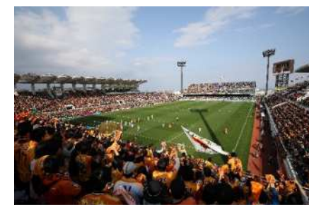
熱気と歓声に包まれるIAIスタジアム日本平

スポーツには「人やまちを元気にする力」「人と人とを繋ぐ力」があります。プロスポーツチーム等連携プロジェクトでは、皆様と共に、本市とチームとが連携し、 スポーツの力で、誰もが健康で心が満たされるまちをつくりあげます！ ぜひ、ご支援とご協力をお願いします。