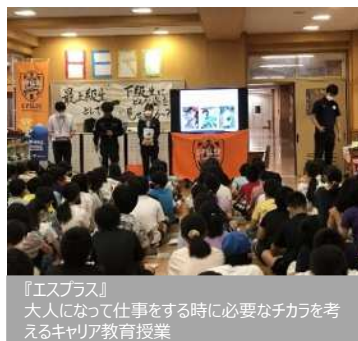
『エスパルス』 大人になって仕事をする時に必要なチカラを考 えるキャリア教育授業