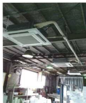
中小企業等業務継続強化事業費助成のイメージ