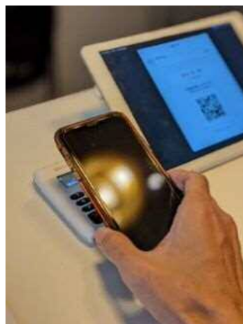
地域消費促進事業費助成のイメージ