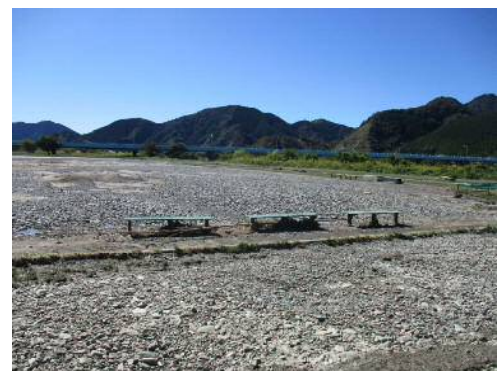
⑥狩野橋スポーツ広場(葵区与一)の被災状況