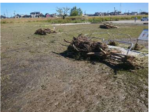
⑦安倍川緑地(駿河区中野新田)の被災状況