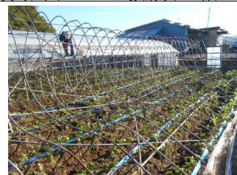
⑩農業用施設の被災状況