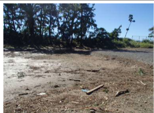
⑧三保真崎グラウンドゴルフ場(清水区三保)の被災状況