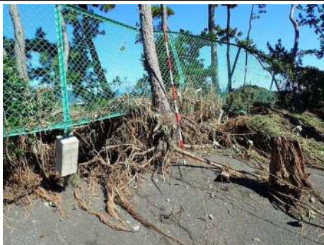
⑨三保松原(清水区三保)の被災状況