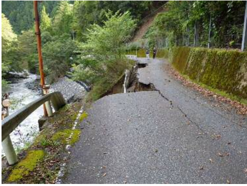
①仙俣線(葵区口仙俣)の被災状況