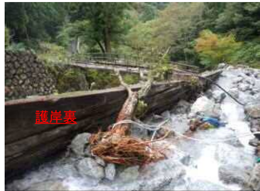
④有東木東沢川(葵区有東木)の被災状況