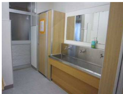
小中学校校舎トイレリフレッシュ事業の例