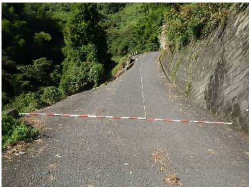
⑤農道大平幹線1号線(葵区下)の被災状況