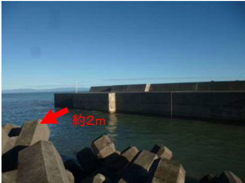
③用宗漁港(駿河区広野)の被災状況