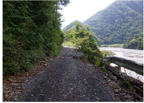
②林道東俣線(葵区田代)の被災状況