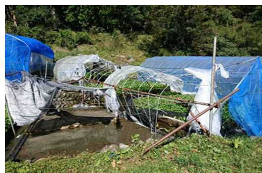
わさびビニールハウス破損(葵区梅ヶ島)