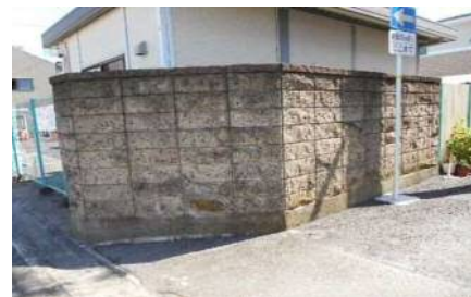
撤去改修前(イメージ)