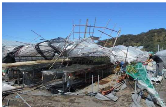
いちごビニールハウス全壊(駿河区古宿)