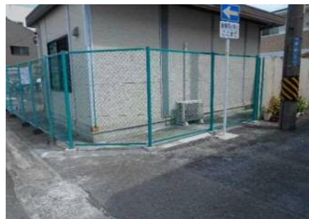
撤去改修後(イメージ)