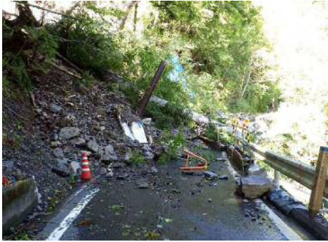
① (主) 井川湖御幸線 (葵区口坂本) の被災状況