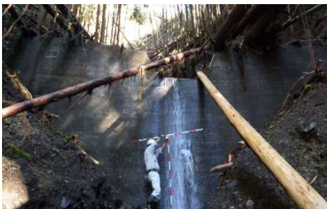
⑦ 治山施設 (葵区奥池ヶ谷) の被災状況