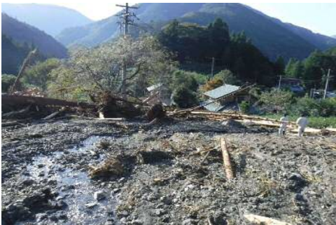
③ 奥池ヶ谷沢川 (葵区奥池ヶ谷) の被災状況