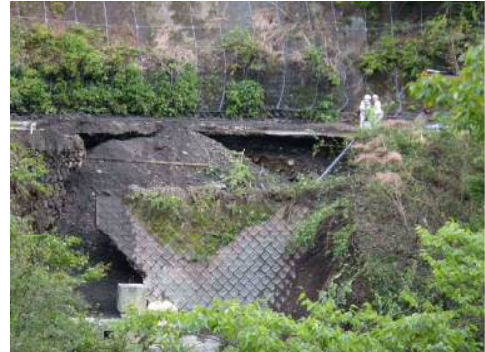
② (主) 南アルプス公園線 (葵区田代) の被災状況