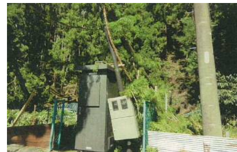
⑧ 賤機北農業集落排水施設 (葵区俵沢) の被災状況