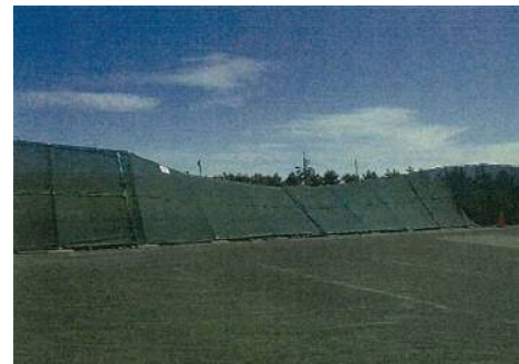
⑥ 中島テニスコート (駿河区中島) の被災状況