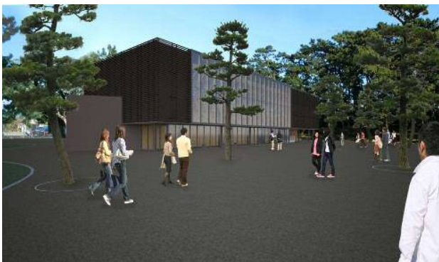
三保松原文化創造センター外観のイメージ