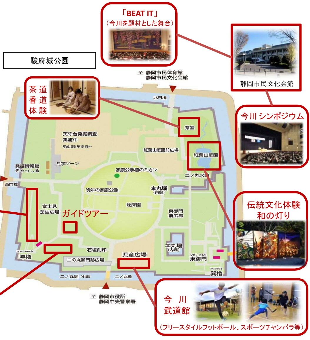
今川復権まつりの実施場所等