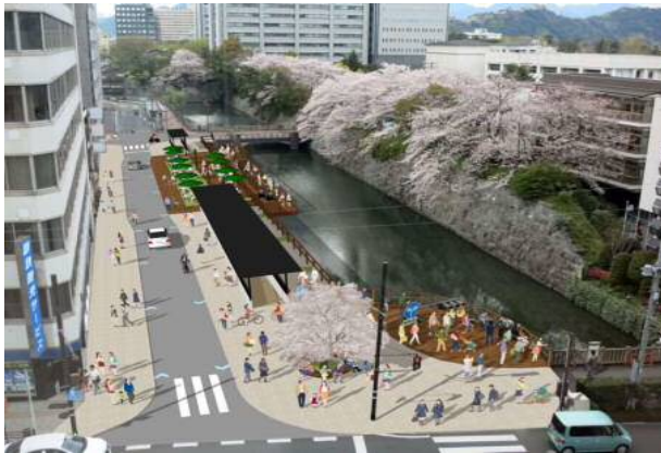
追手町音羽町線の整備イメージ