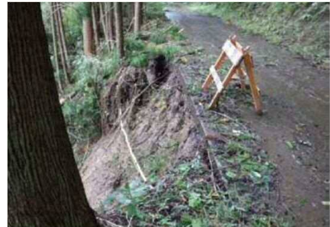
④ 林道桑又線 (清水区中河内) の被災状況