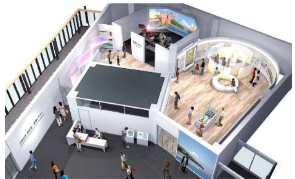
三保松原文化創造センター内のイメージ