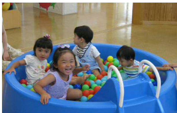
保育施設における子どもたちの様子