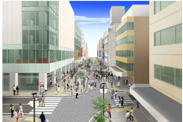
呉服町通線（紺屋町地区）の整備イメージ