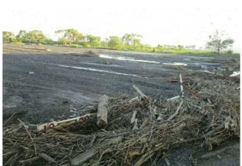
⑤ 中原スポーツ広場 (駿河区中原) の被災状況