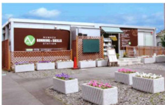
(参考)沼津ランニング&スキルズステーション