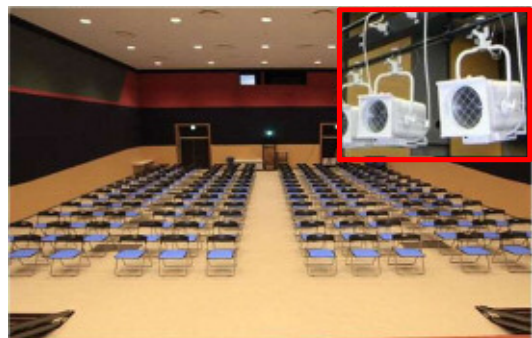
MIRAIEリアン多目的ホールの様子 (設置する電動照明イメージ)