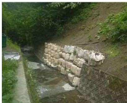
損傷した護岸の様子