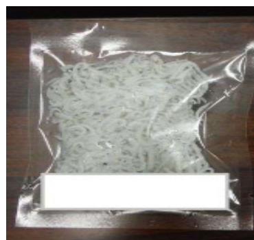
釜揚げしらすの提供イメージ(ビニール個装)