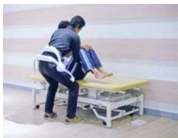
介護ロボット(移乗介助:装着型)のイメージ