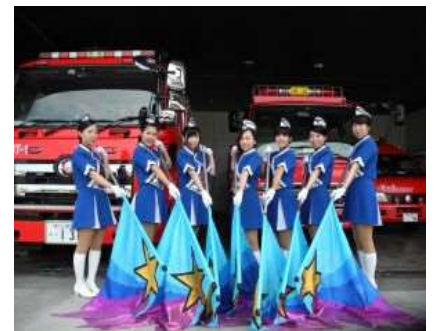
カラーガード隊のイメージ