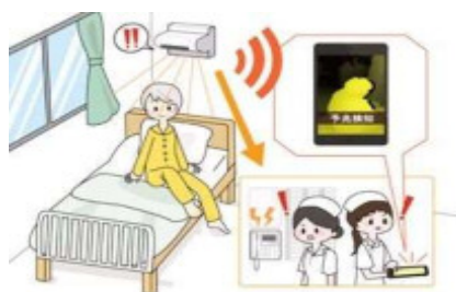
介護ロボット(見守り)のイメージ