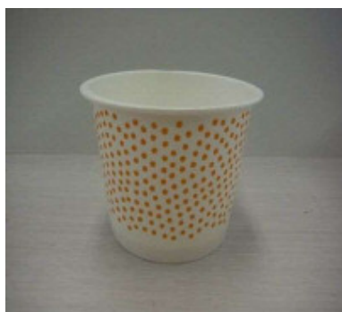
釜揚げしらすの提供イメージ(カップ型)