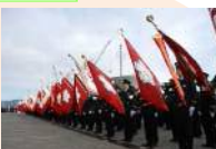
消防団員確保対策事業 (消防局)【109,295千円】