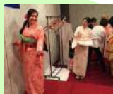
海外姉妹都市交流事業(観光交流文化局)【6,136千円】