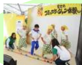
異文化コミュニケーション体験フェア等(市民局)【1,760千円】