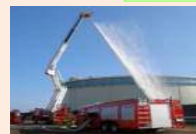
湾岸消防署庁舎移転建設事業 (消防局)【430,816千円】