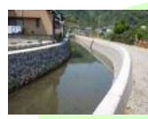
河川改修・下水道施設整備 (建設局)【216,300千円】