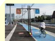
交通安全施設整備事業（自転車走行空間ネットワーク整備事業）（建設局）【174,700千円】