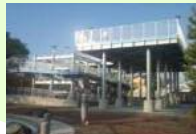
津波避難施設整備事業 (総務局)【108,930千円】