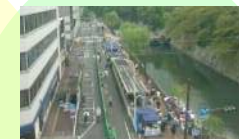
追手町音羽町線等にぎわい空間創出事業（都市局）【10,000千円】