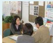
医療・介護・福祉スーパーバイザー人材配置事業（保健福祉長寿局（保健福祉局））【13,000千円】