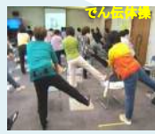
しぞ〜かでん体操大交流会（保健福祉長寿局（保健福祉局））【1,118千円】