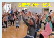
元気いきいき！シニアサポーター事業（保健福祉長寿局（保健福祉局））【85,743千円】