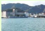
漁港施設機能強化事業 (経済局)【202,000千円】