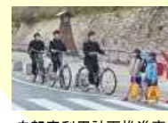
自転車利用計画推進事業（都市局）【6,125千円】