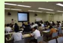
「静岡シチズンカレッジ コ・コ・ニ」推進事業(市民局)【12,000千円】