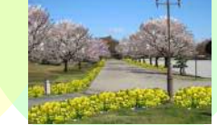
駿府城公園「桜の名所」づくり事業【再掲】（都市局）【22,000千円】