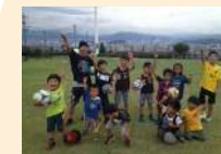
市民協働促進事業「協働パイロット事業」(市民局)【2,420千円】