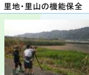
あざはた緑地(第1工区)整備事業(都市局)【150,000千円】