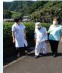
小圏域在宅医療推進モデル事業（保健福祉長寿局（保健福祉局））【736千円】