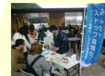
地球温暖化対策啓発事業 (環境局)【1,500千円】