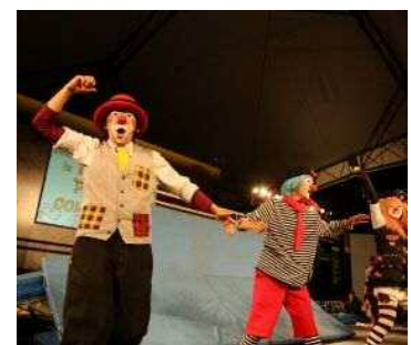
アートプラクティスゾーン