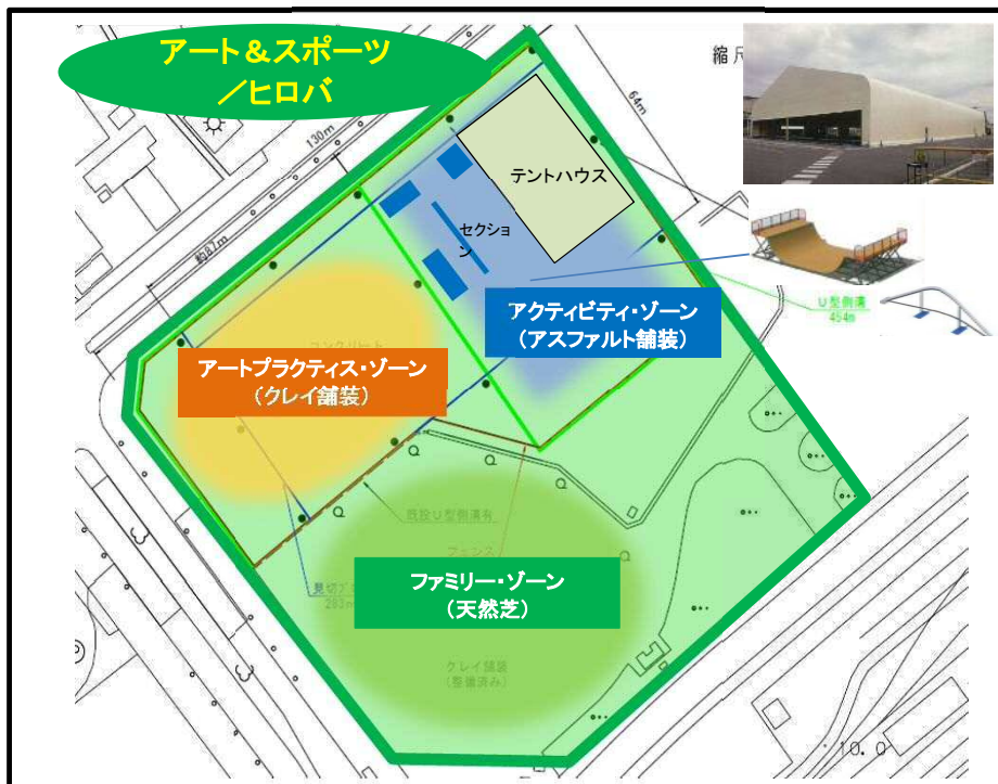
東静岡「アート&スポーツ/ヒロバ」整備イメージ

アーティストと市民が一体となって取り組む、創造的なまちづくりの魅力を国内外に発信することで、インバウンド効果を生み、交流人口の増加による経済的な効果をもたらすことも狙いとしている。