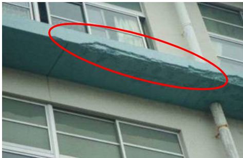
劣化した小中学校校舎外壁