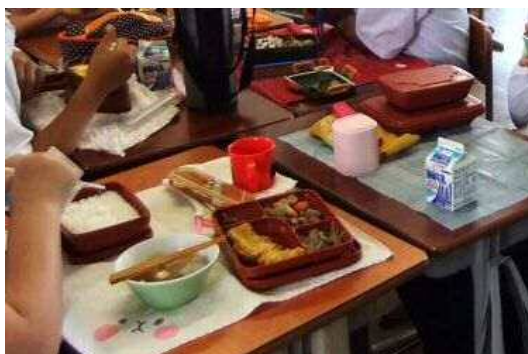
校外調理委託による中学校の昼食時の様子