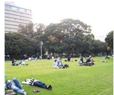
ファミリーゾーン