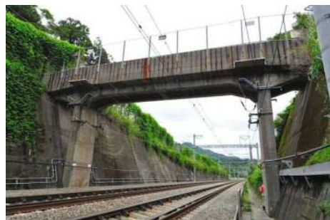
老朽化したこ線橋の様子