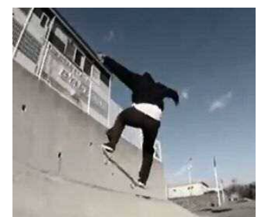
アクティビティゾーン