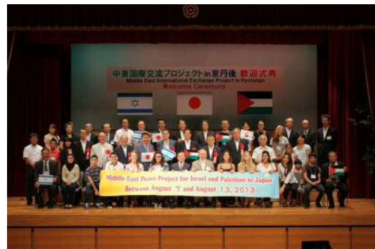
中東国際交流プロジェクト 前回(京丹後市開催)の歓迎式典の様子