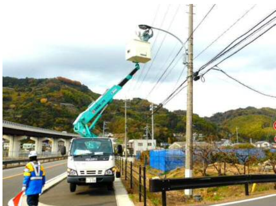
道路照明灯の点検