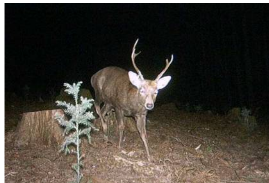
植林地を荒らすシカ