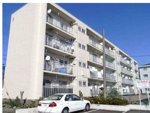
市営住宅の外壁改修の例(上土団地)