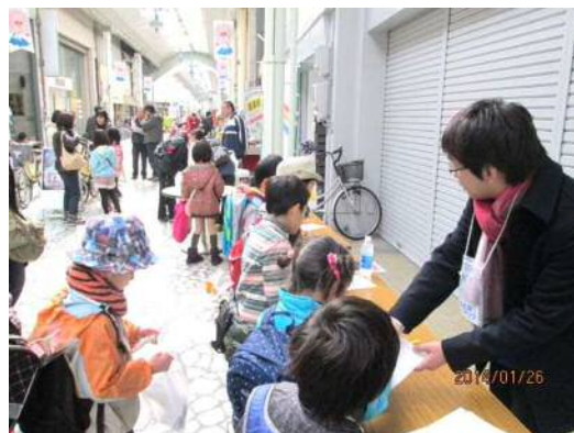
清水都心の商店街にぎわい事業の様子