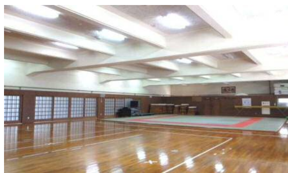
屋内運動場(吊天井等撤去改修後のイメージ)