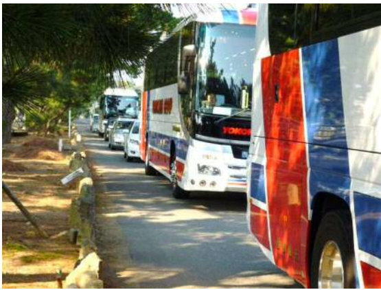
三保松原(神の道)の渋滞の様子