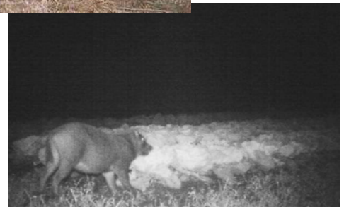
キャベツ畑を荒らすイノシシ