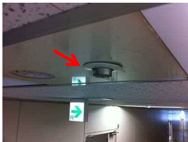
スプリンクラー設備の設置例