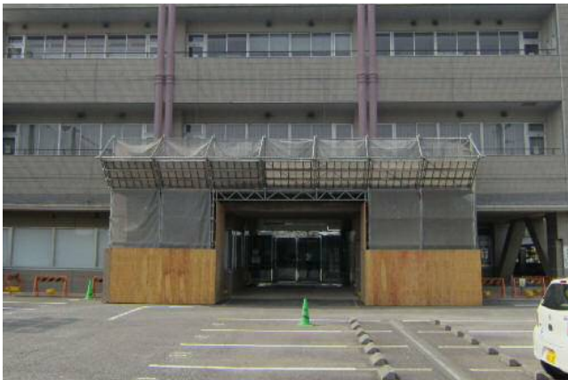
緊急安全対策の様子