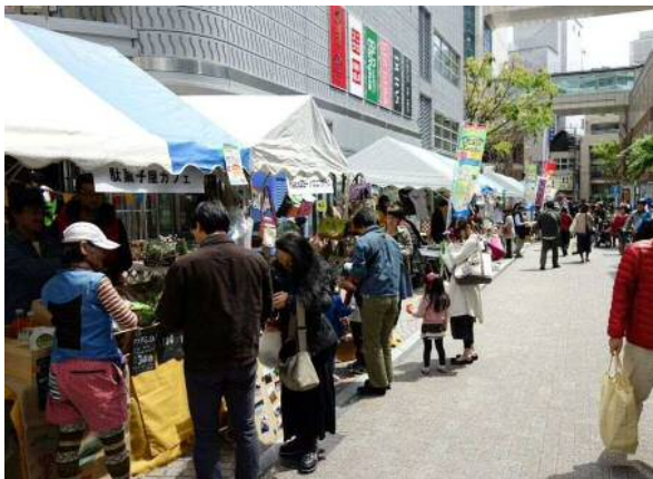
御伝鷹(みてた)地区のイベントの様子