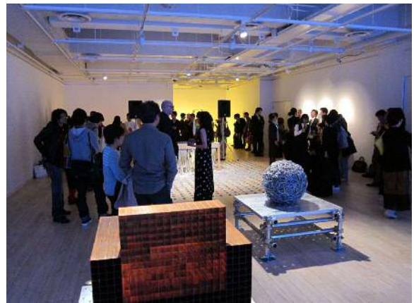
コンテンツ発表会の様子