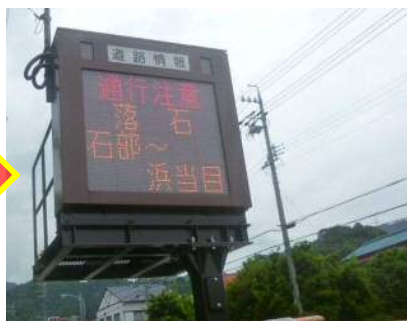
道路情報板の更新の例