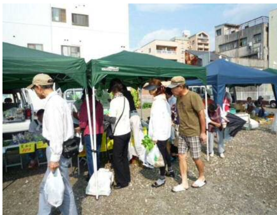
七間町(アトサキ7)でのイベントの様子