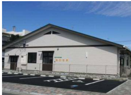
待機児童園の設置例(おひさま: 駿河区登呂)