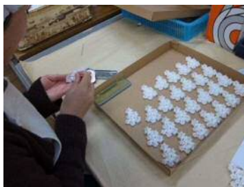
就労継続支援B型事業所における作業の様子