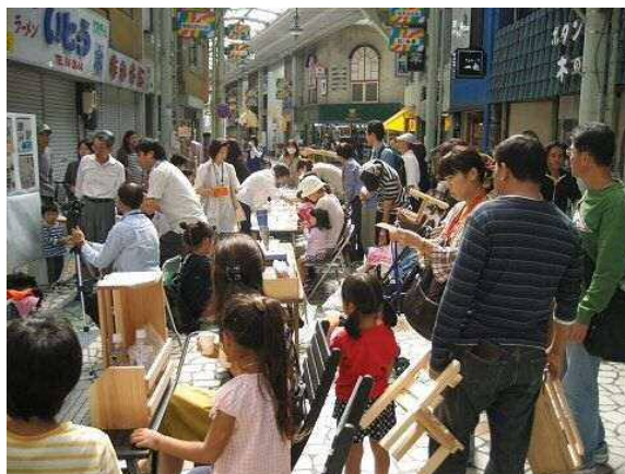
清水駅前商店街でのイベントの様子