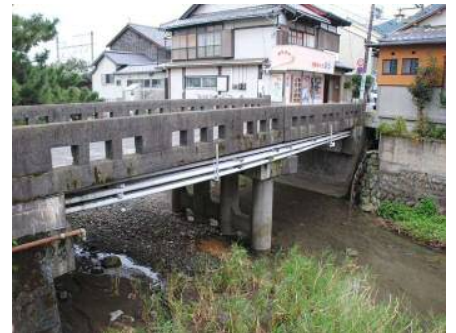
由比停車場線(共進橋)