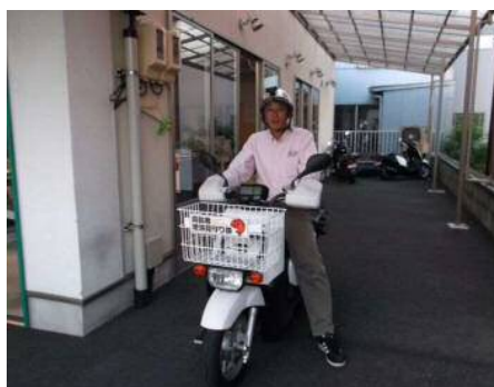
高齢者見守り隊(バイクのかごにつけるプレートの例)