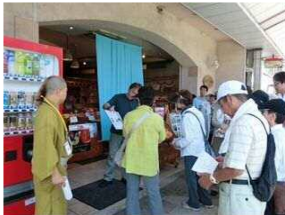
浅間通り商店街でのイベントの様子