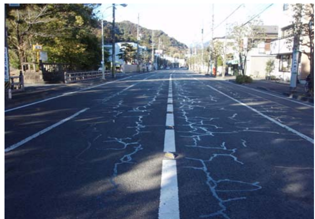
麻機街道線 舗装補修事業