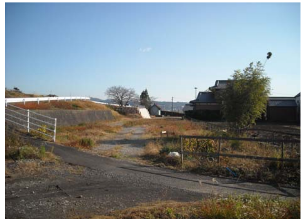
国吉田瀬名線 道路改良事業