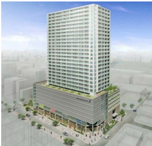
静岡呉服町第一地区市街地再開発事業