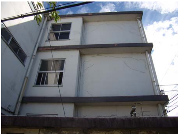
東豊田小学校 校舎外壁の状況