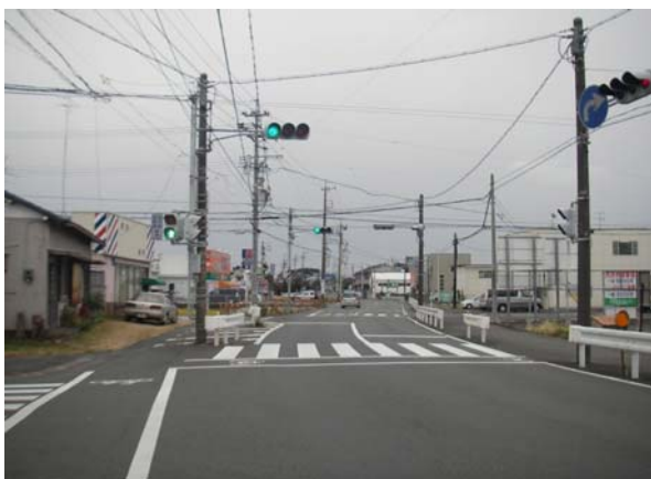
静岡下島線 道路改良事業