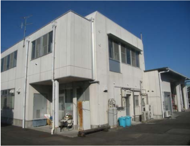
石田消防署 鎌田出張所 建物外観状況