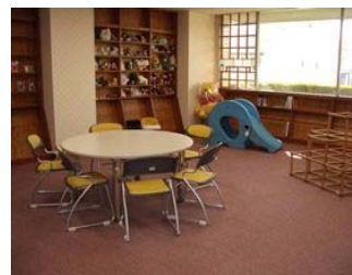
静岡市児童相談所(葵区堤町)