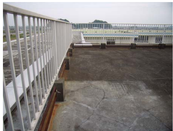
長田北小学校 校舎屋上の状況