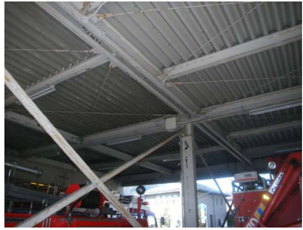
石田消防署 鎌田出張所 車庫の状況