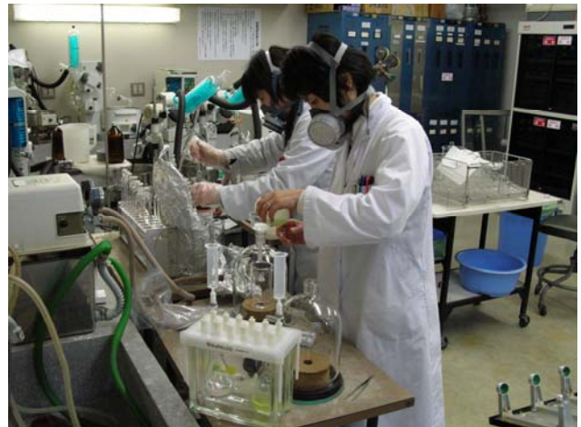
環境保健研究所 検査実施状況