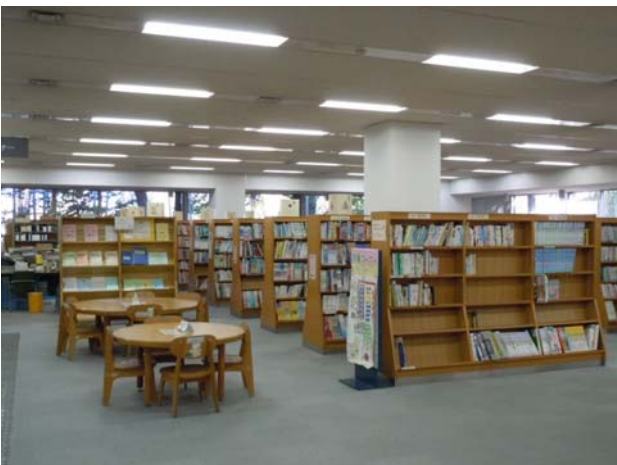
図書整備充実事業(中央図書館)