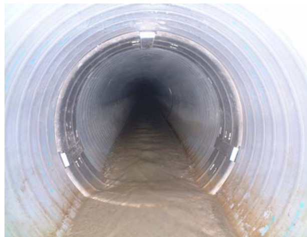
耐震補強した下水道管(施工事例)