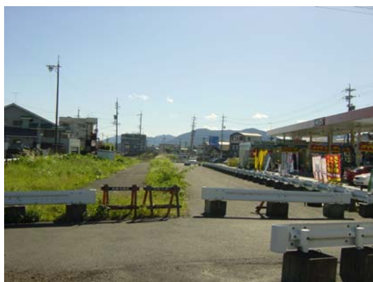
静岡駅賤機線 昭府町工区