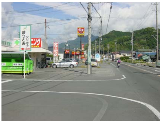
静岡駅賤機線 松富2工区