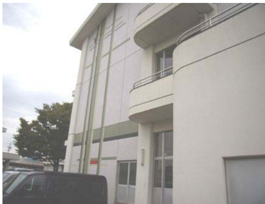
小中学校校舎補修事業(宮竹小学校)