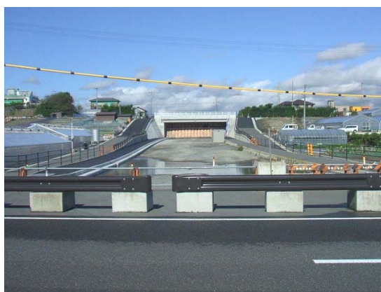
県道駒越富士見線(駒越)