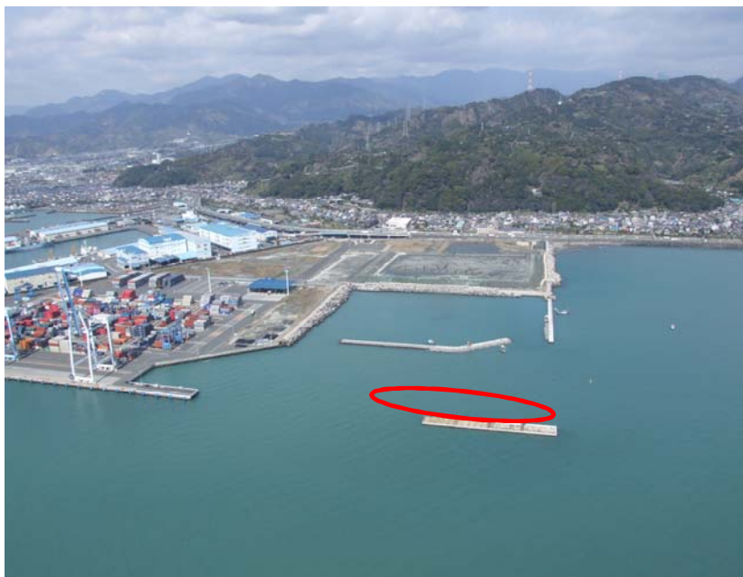
特定重要港湾 清水港(直轄事業負担) 岸壁裏込工工事