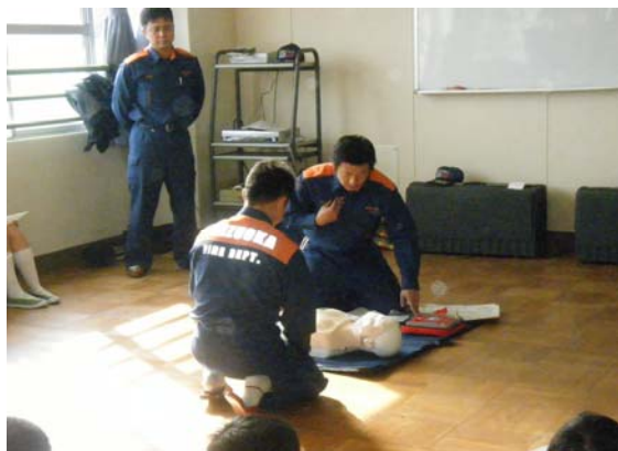
AEDを使った救命講習会