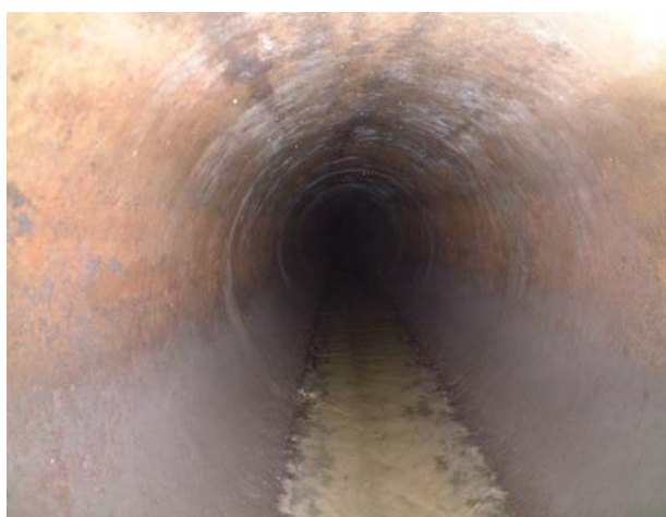
老朽化した下水道管