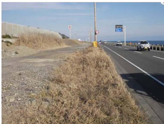
国道150号(久能) 2車線→4車線