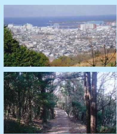
森林浴しながらのんびり散策。所々に富士山や清水港が見えます。