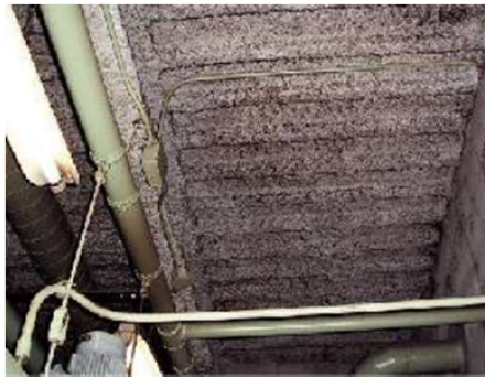
鉄骨の柱・梁 デッキプレートの裏