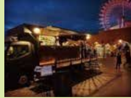
TRACK BAR GOGH