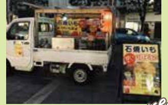
やきいも道 and more!