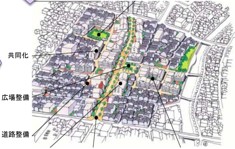
共同化 道路拡幅 共同化 ※住宅市街地総合整備事業パンフレットより (住宅市街地整備推進協議会)