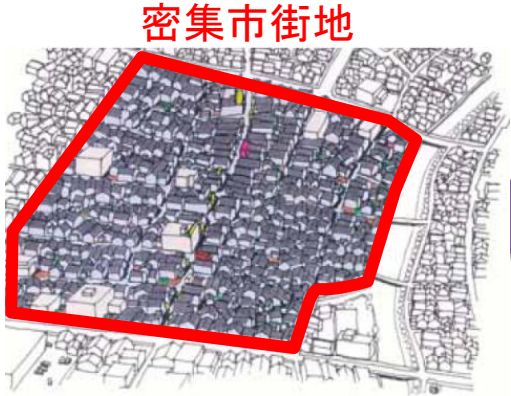
※住宅市街地総合整備事業パンフレットより (住宅市街地整備推進協議会)

⑥協議会は市に「地区復興まちづくり計画」を提案 ⑦市は提案を踏まえながら、復興基本計画を策定 公園整備(防災機能充実)