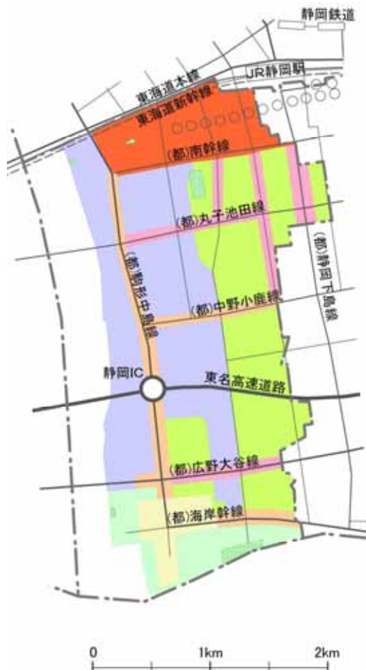
土地利用の誘導方針図