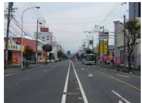
沿道利用地((都)中野小鹿線)