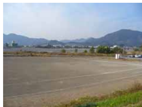
広域避難地（中原スポーツ広場）