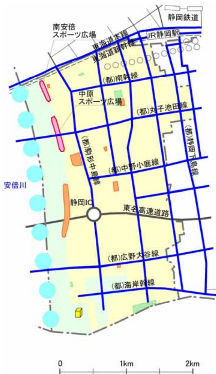
地域防災の方針図