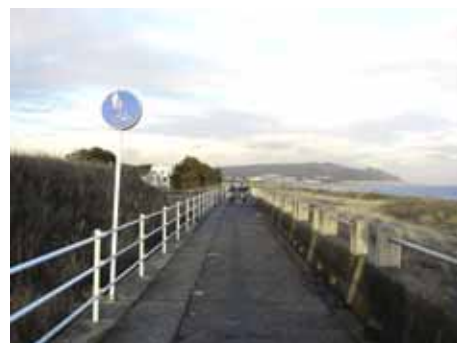
安倍川河口から大浜公園を經由する海岸線のルート