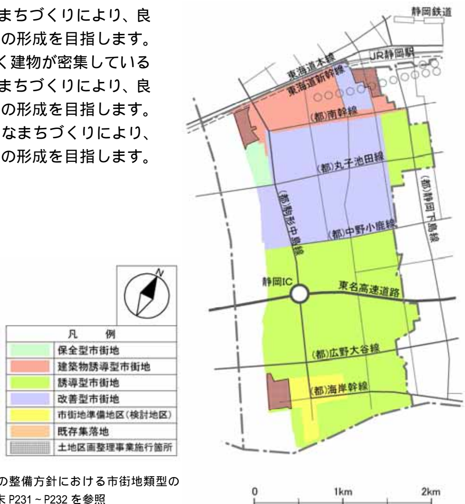
市街地環境の整備方針図

市街地環境の整備方針における市街地類型の考え方は巻末 P231 ~ P232 を参照