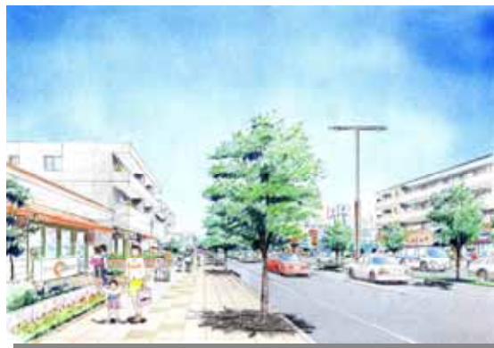
(都) 広野大谷線の整備イメージ