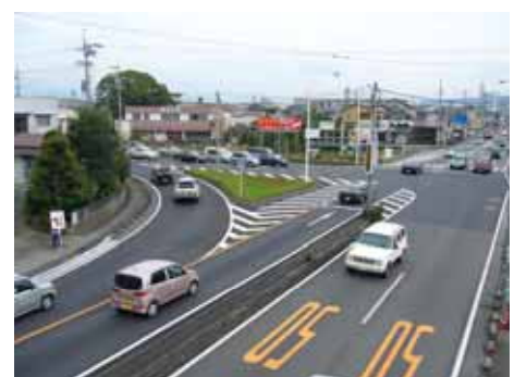
主要幹線道路((都)広野大谷線)