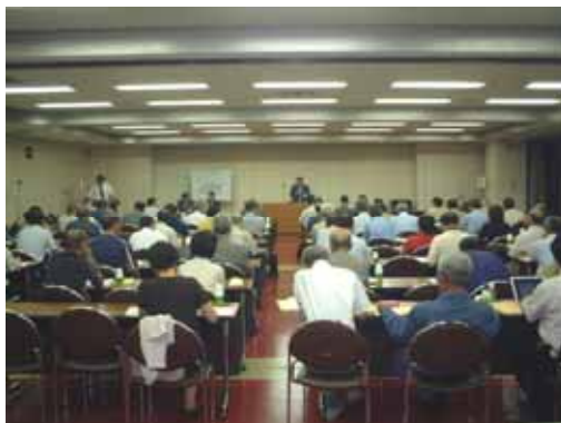
地域協議会の開催状況(合同開催)