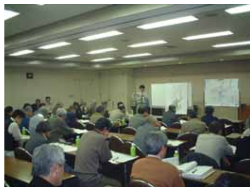
合同報告会の開催状況