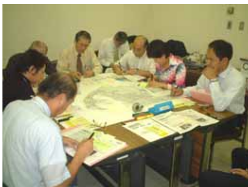
地域協議会の開催状況