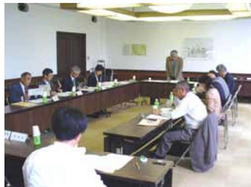
策定懇話会の開催状況