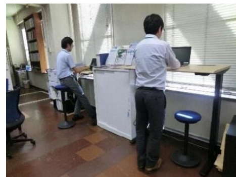
スタンディングデスク