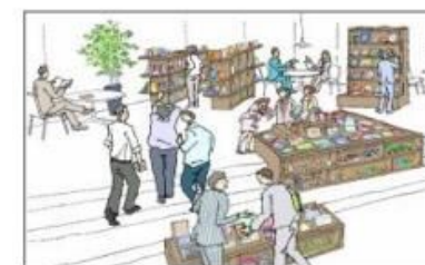
情報発信コーナー (宇部市計画)