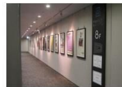
展示ギャラリー (豊島区役所)