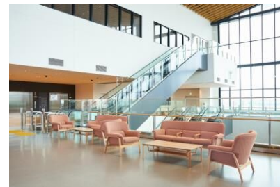
ゆとりのある待合スペース・対話スペース