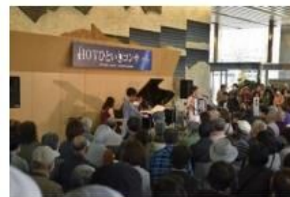
HOTひといきコンサート (葵区役所)