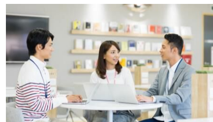
市民の交流・活動の場