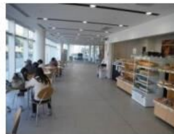
売店・カフェの併設 (東広島市)