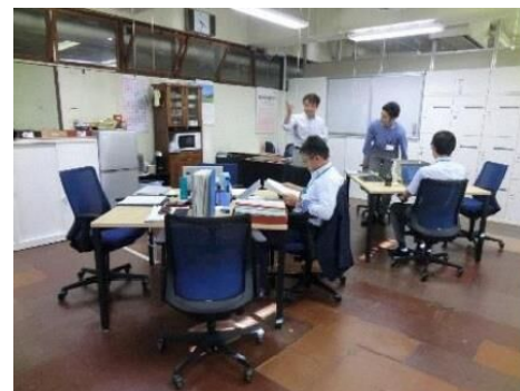
フリーアドレスの執務室