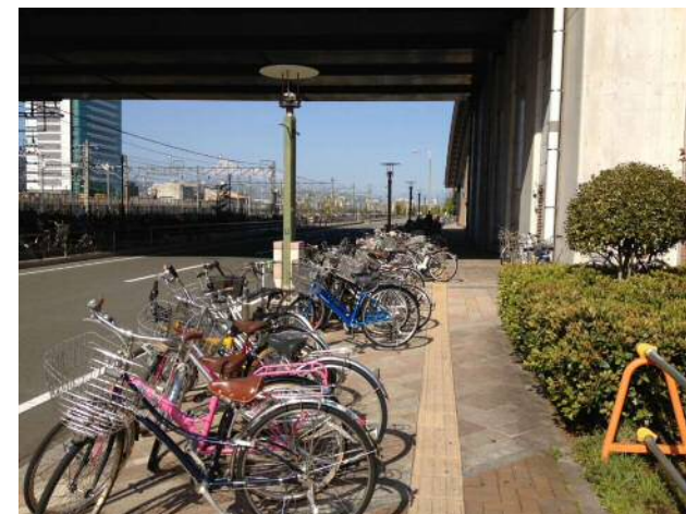
写真：東静岡駅南口の放置駐輪状況（H25）