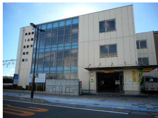
写真：清水駅西口第1駐輪場（有料・建物）