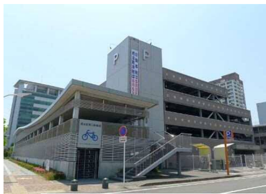
3. 清水駅東口駐車場