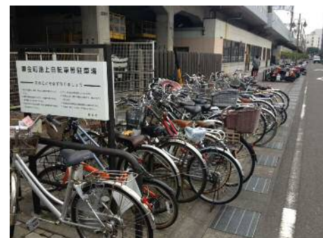
写真：黒金町路上駐輪場（無料）