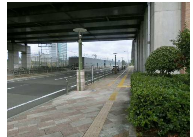
写真：東静岡駅南口駐輪場整備後の状況（H28）