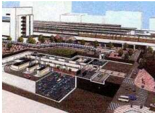
1. 静岡駅北口駐車場：エキパ

施設の配置について、別紙「駐車場・駐輪場配置図」参照 施設の面積等の詳細について、別紙「駐車場一覧表」参照