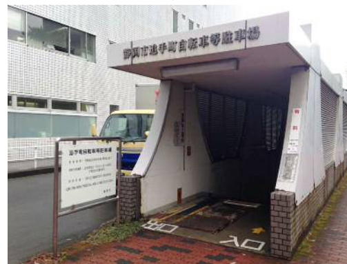
写真：追手町駐輪場（有料・地下）