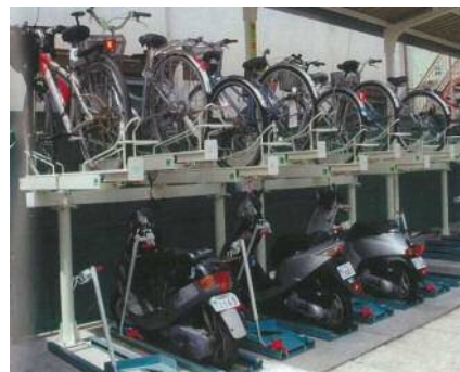
写真：自転車用ラック（2段式）及び原動機付自転車用ラック