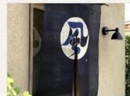
麻暖簾 風の宇文 90×150cm 27,000円(税2,000円)