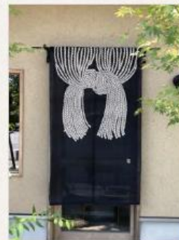
麻暖簾 縄のれん文 90×15... 27,000円(税2,000円)