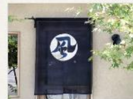
麻暖簾 風の宇文 90×120cm 24,840円(税1,840円)