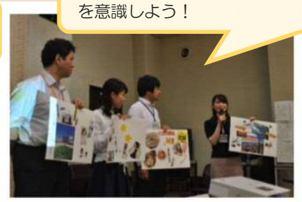
「ハートフル = ころがあったか」を意識しよう！