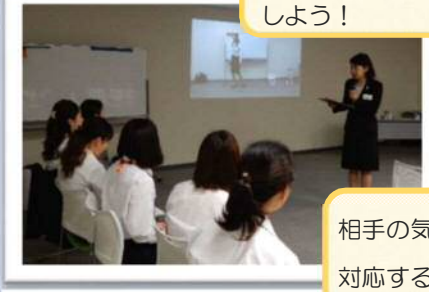
相手の気持ちになって丁寧に対応することを大切にしたい！