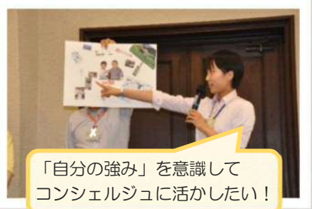
「自分の強み」を意識してコンシェルジュに活かしたい！