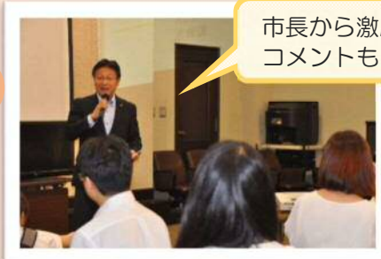
市長から激励コメントも！

『本人が意識しなくても出てくる思考、感情、行動』など、表に出てきやすい素質です。