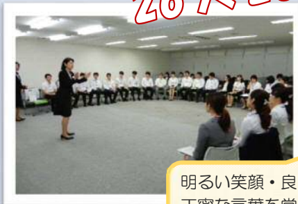
明るい笑顔・良い姿勢・丁寧な言葉を常に意識しよう！