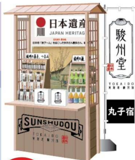
※売り場のイメージです