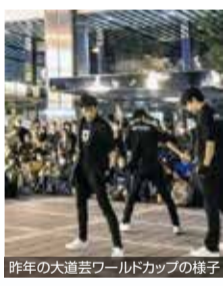
昨年の大道芸ワールドカップの様子

この「ON STAGE SHIZUOKA」は、「あなたにとってのステージはたくさんある」という意味です。道路や公園などの公共空間も、見方を変えればステージ(舞台)に早変わり。そして、年齢、性別、障がいの有無に関わらず誰もが活躍できるステージ(場面)がそこにある。そういった思いが込められているのです。