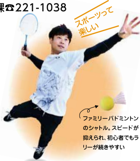
ファミリーバドミントンのシャトル。スピードが抑えられ、初心者でもラリーが続きやすい

ニュースポーツはルールが易しく、初めて取り組む人にも親しみやすいものです。市では、定期的にニュースポーツ体験会などのイベントを実施していますが、「競技スポーツ