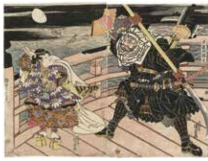
▲歌川国貞「武蔵坊弁慶 御書子牛若丸」文化10-11年(1813-14)頃

休館日▶月曜日、7/19(火) ※7/18(祝)、8/15(月)は開館 観覧料▶1,500円、大高生・70歳以上1,100円(中学生以下・障がい者手帳等を持っている人とその介助者原則1人は無料) ※同館HPより日時指定予約可