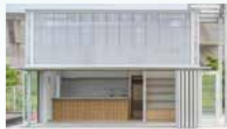
▲トライアルキッチン