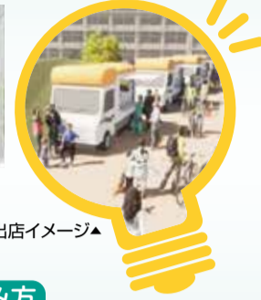
▲キッチンカー出店イメージ▲