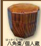
はっかくなつめ八角薬/個人蔵