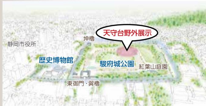
▲フィールドミュージアムのイメージ図

これらを地域資源として磨き上げていくため、慶長期・天正期の2つの天守台を野外展示として整備する計画を進めています。