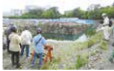
▲フィールドワーク