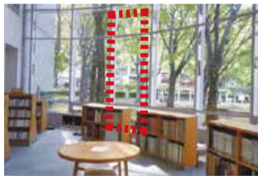
▲公園側出入口設置場所

今まで出入口は正面入口の1か所でしたが、城北公園側にも出入口を設け、図書館と公園を自由に行き来できるようになります。