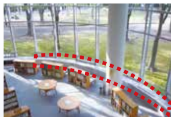
▲1階読書席新設場所

読書席を1階に18席、2階に11席新設し、開放感のある空間で読書ができるようになります。