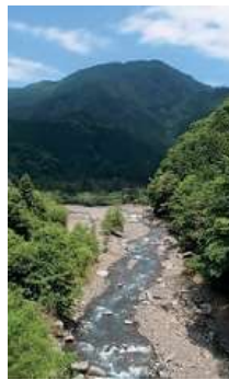
新田吊り橋から見た安倍川

大規模な開発事業等を実施する際に、事業が環境に与える影響を事前に調査・予測・評価し、その内容に併せて環境保全等に関する対策を講ずるなどの措置を住民や行政等から意見を聴き、環境保全等に配慮するよう努めることの一連の手続。