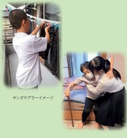
ヤングケアラーイメージ