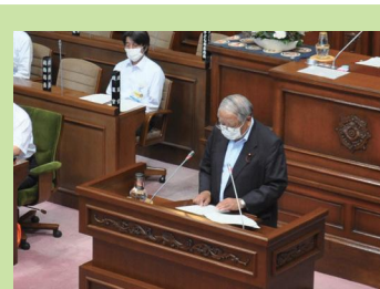
審査結果を報告する総務委員長