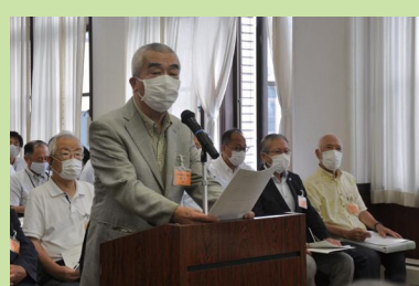
審査にあたり、意見を述べる請求代表者