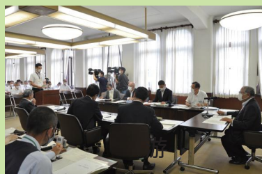
総務委員会での審査の様子