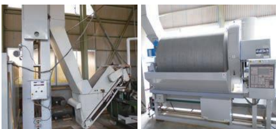
加工施設機械整備事業により導入・更新した製茶機械

後継者不足や高齢化などにより人手不足に悩む農業者とそれをサポートしたい消費者を結ぶ事業。令和2年8月31日現在で322人の登録がある。