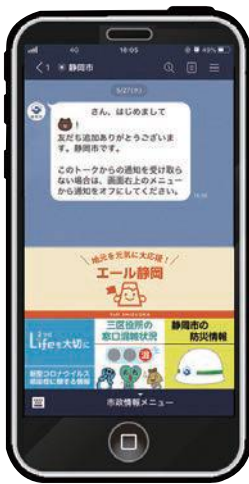
静岡市LINE公式アカウントはこちらから

LINEはSNS (ソーシャルネットワーキングサービス) の一種。自治体公式アカウントなどを登録すると発信される情報をリアルタイムで受け取れることもできる。静岡市公式アカウントは令和2年6月10日に運用を開始した。