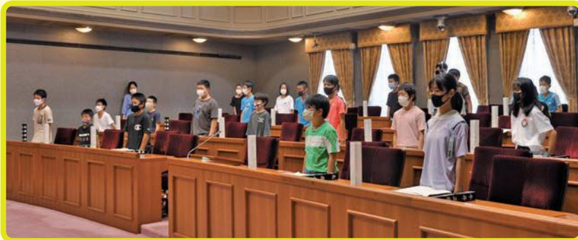
▶議員役児童による起立採決の様子。