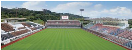
IAIスタジアム日本平

令和2年7月16日に静岡県とENEOS株式会社が締結した「静岡市清水区袖師地区を中心とした次世代型エネルギーの推進と地域づくりにかかる基本合意書」。本合意書は県と当社が相互に連携し、同社所有の清水製油所跡地を中心に次世代型エネルギー供給拠点ならびにネットワークを構築するとともに、魅力的かつ持続可能な地域づくりに貢献することを目指すもの。