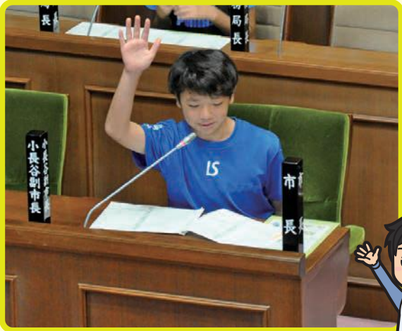
▶発言する時は、挙手をして議長に許可を求めます。