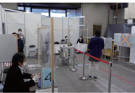
清水区役所期日前投票所

投票日当日に仕事や用事などで投票できない方が、選挙期日前に投票できるように設置する投票所。