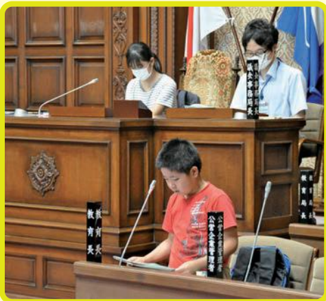
▶議員役児童からの質問に対して、市長や局長役の児童が答弁します。