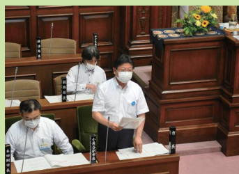
議案に付した意見の説明をする市長