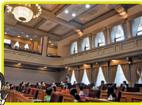
▶議場の歴史や設備についても学びました。