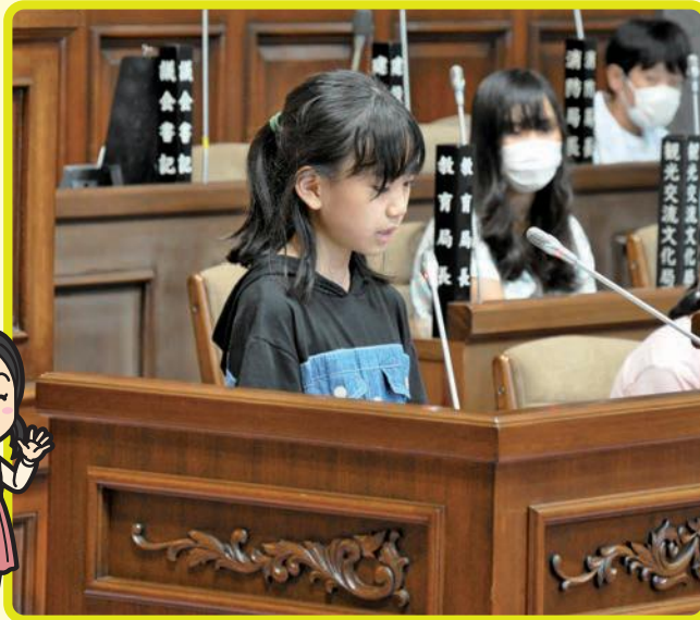
▶演壇で質問をする議員役児童。

静岡市議会では、市議会への興味や関心を高めることができるよう、市内小学生を対象に「子ども模擬議会」を開催しています。7月22日に井宮北小学校の6年生が参加した模擬議会の様子をお知らせします。