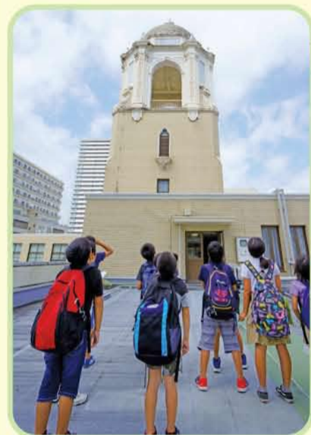
⑥傍聴席から外に出て、次はあおい塔に のぼっていきます。