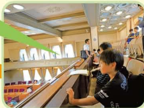
⑤傍聴席から議席に座るお友達の様子を 真剣に見ています。

Q.形がちがう席があるのはなぜ? A.車いすの方も議会を 傍聴できるようにする ためです。