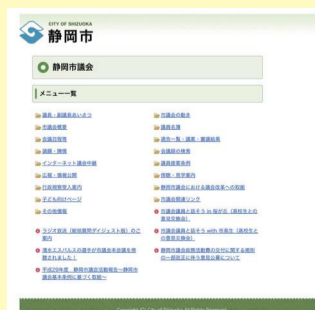
市議会ホームページのトップページ

市民の皆さんに親しまれる市議会だよりを目指しています。 お気軽にご意見・ご感想をお寄せください。