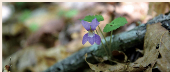
29年度調査で発見されたミヤマスマミレ(重要種)