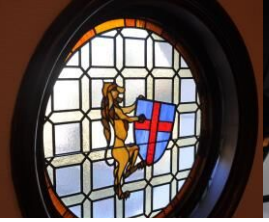
议会会场内的彩绘玻璃