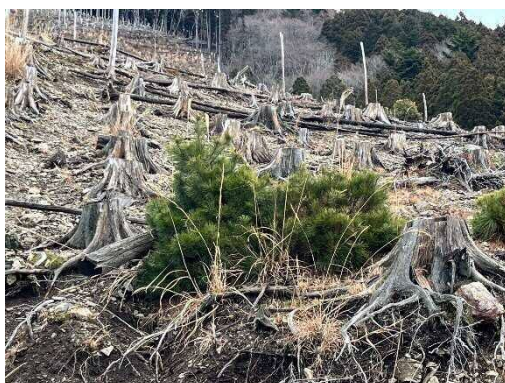
<伐採後に植林されていない様子(森林管理)>

巴川などの治水対策も重要であるが、事前防災・流域治水としては、山の森林管理や保水力の向上などが重要であると改めて認識。県とともに山の問題に取り組んでいく。