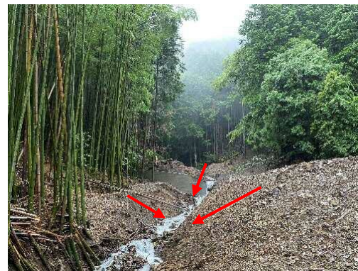
<土砂流出の様子(油山の観音沢川)>