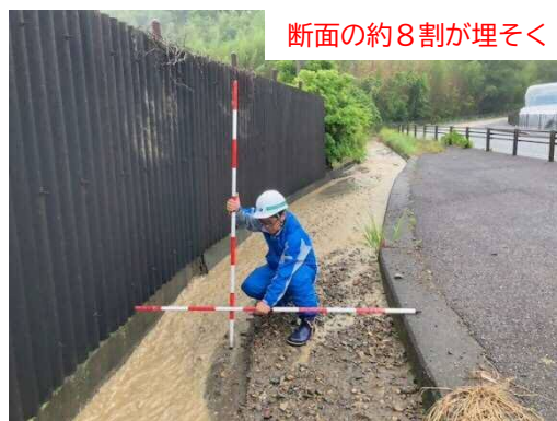
<土砂堆積の様子(杉沢川)>