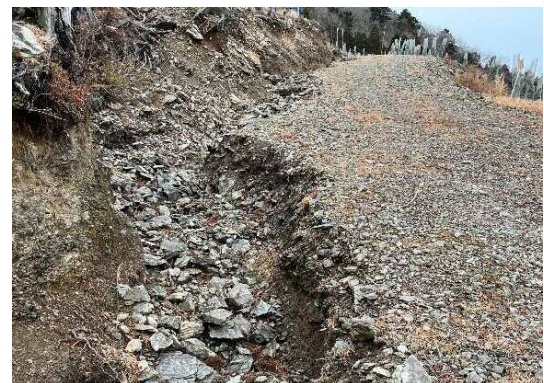
<法面流水による土砂流出(保水力低下)>