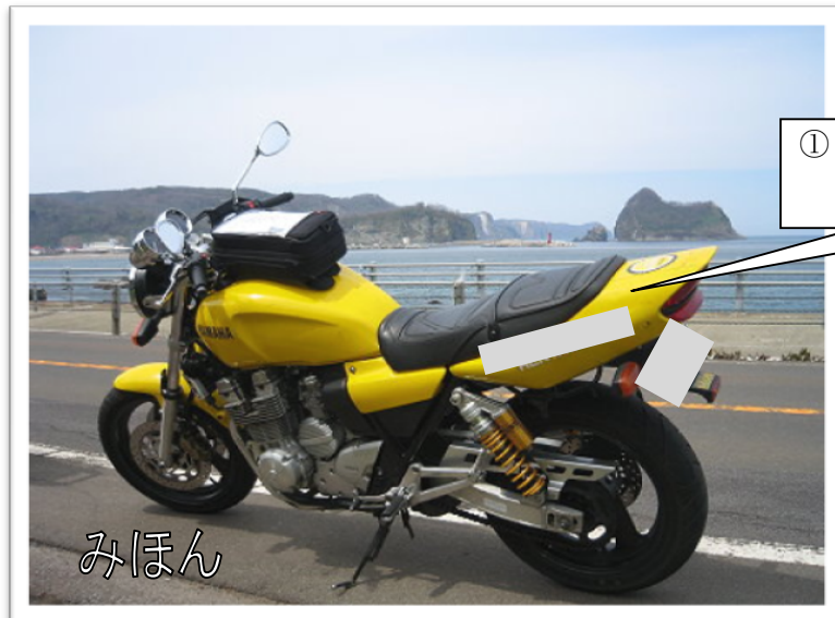
① 変更後の車体全体の写真 (エンジン部が写った状態)