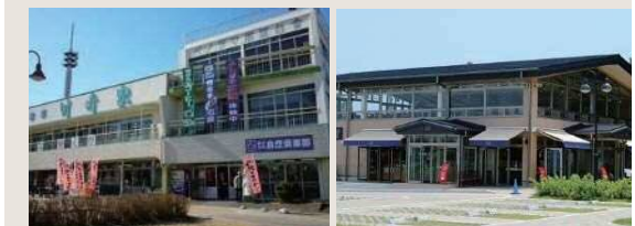
B (株)自然倶楽部(日本平石鹸販売) 054-334-8887 C 日本平月日星(食事・おみやげ) 054-334-1485