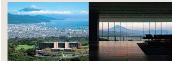
A 日本平ホテル 054-335-1131