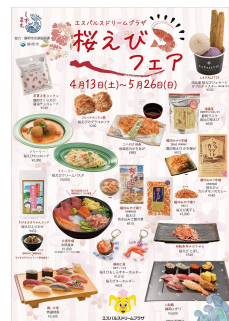
桜えびフェア チラシ