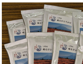
しずまえ桜えびふりかけ (※1袋あたり1食分程度)