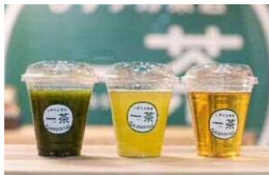
しずちカ茶店 一茶Seasonal