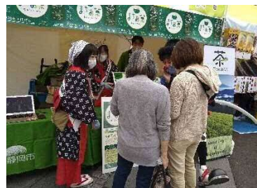
「お茶のまち静岡市」情報発信拠点