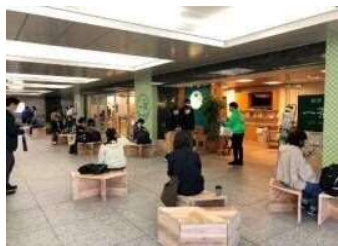
しずちカ茶店 一茶Seasonal