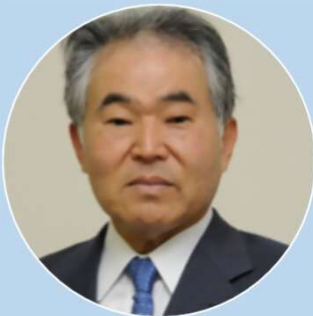
大竹英雄 名誉碁聖