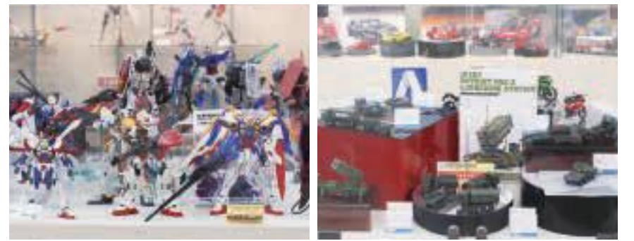
静岡の模型メーカー6社(静岡文化教材社、(株)ウッディジョー、(株)エムエムピー、(株)タミヤ、(株)ハセガワ、(株)BANDAI SPIRITS)の製品が展示されています。