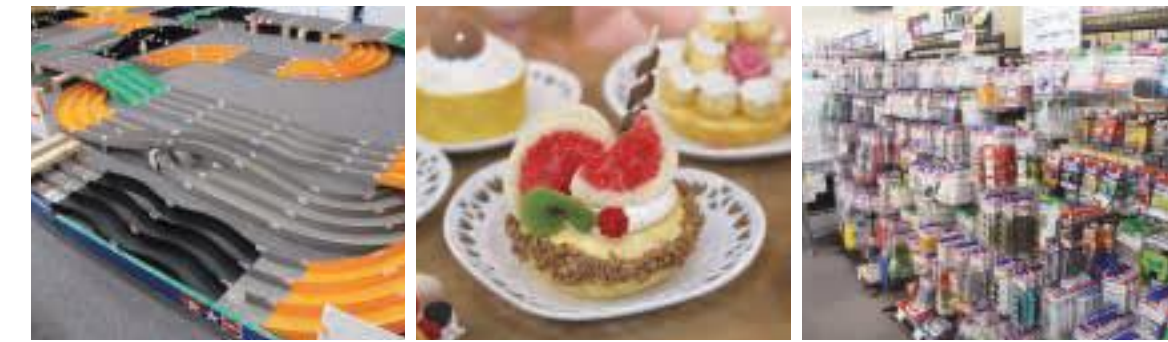
ミニ四駆サーキット スイーツデコレーション オフィシャルショップ

施設内にはミニ四駆のサーキットが常設されています。また、女性に人気のスイーツデコレーションの製作体験を定期的に開催しているので興味ある人はHPをチェックしよう!