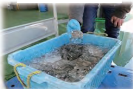
じょうたいかくにん 状態確認