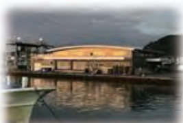
もちむねうおいちば 用宗魚市場