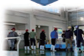
らくきつ うんぼん 落札～運搬

ていきます。 が決定します。そして、あつという間に加工所へと運ばれ 確認、ほどなく入札開始のベルが鳴り数分後には落札者 確認、ほどなく入札開始のベルが鳴り数分後には落札者 れます。市場では仲買人が待ち受け、しらすの状態を 決めます。市場では仲買人が待ち受け、しらすの状態を せりは7時30分頃から、運搬船が港に着く度に行わ もう1艘が獲れたしらすを港に運搬します。 を出港していきます。沖に出た船は2艘で網をひき、 早朝7時、用宗ではしらす漁を行う船が一斉に港 早朝7時、用宗ではしらす漁を行う船が一斉に港