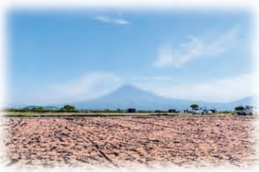
↑ 獲れた桜えびは、富士川河川敷で天日干しされます。