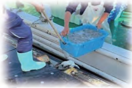
うんぼんせんとうちやく 運搬船到着