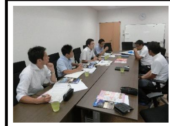
↑ 由比港漁協での取材の様子 と話をしてくれました。

今後、静岡の地域について「しずおか学」の授業が小中学校で始まります。その中の「しずまえ」の本を作成する学校の先生方にお話を聞きました。「本を作る中で、今まで自分たちも知らなかったしずまえの魅力が発見しています。ぜひ子どもたちにこの魅力をたくさん知ってもらい、市内外の人に発信できるようになってほしいです。」