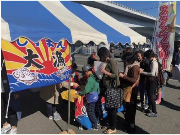
「由比港浜の市」にてスタンプラリーを楽しむ参加者たち

「ゆいトーク」も行われました。由比の町が多くの人でにぎわう 節目の一日となりました。 桜えびが大人気の由比 地区ですが、それ以外にも アジやタチウオなど多くの 種類の魚が獲れます。ぜひ 由比に足を運び、旧東海道 の街並みを楽しみながら、 新鮮なしずまえ鮮魚を味わ ってみてください。