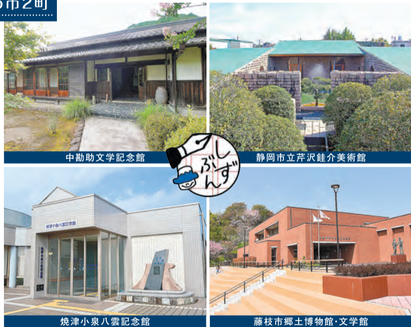
中勘助文学記念館