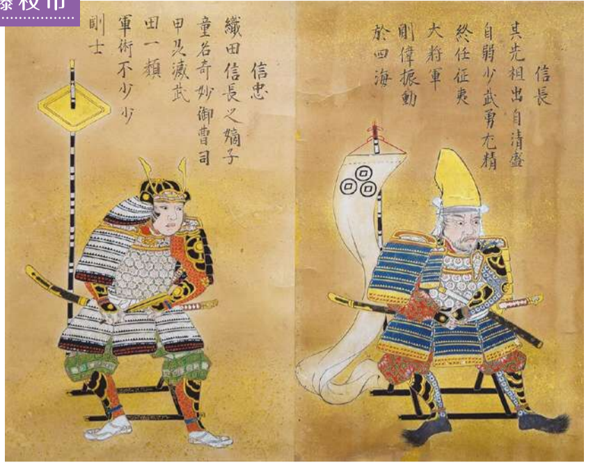
織田信長・信忠(泰巖歴史美術館)