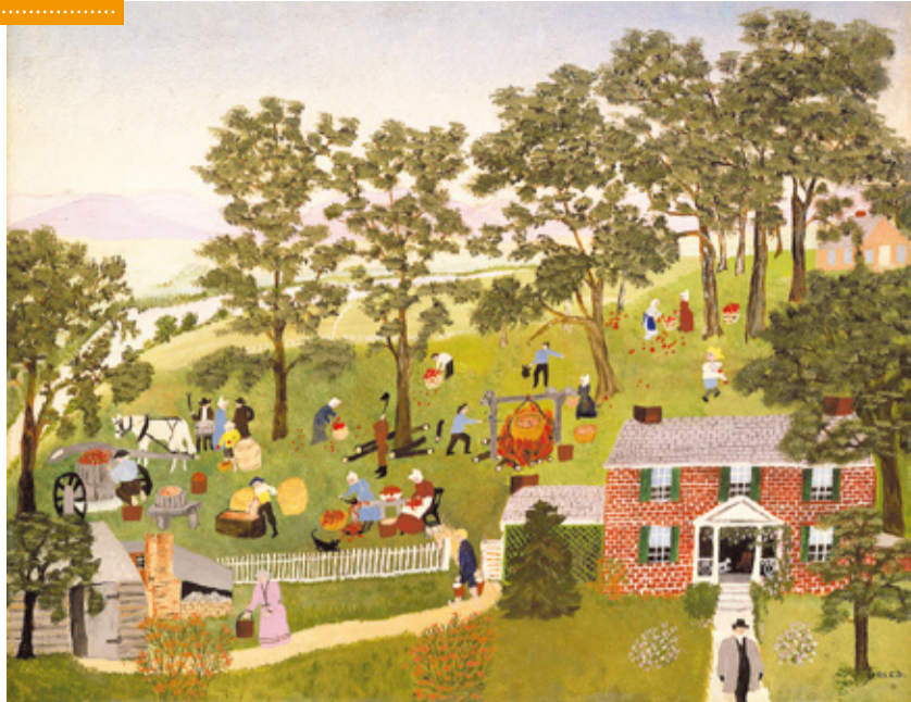
アンナ・メアリー・ロバートソン「グランマ・モーゼス〈アップル・バター作り〉(部分) 1947年 個人蔵(ギャラリー・セント・エティエンヌ、ニューヨーク寄託) ©2021, Grandma Moses Properties Co., NY