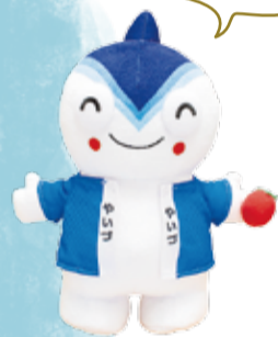
焼津市公認マスコットキャラクター 「やいちゃん」