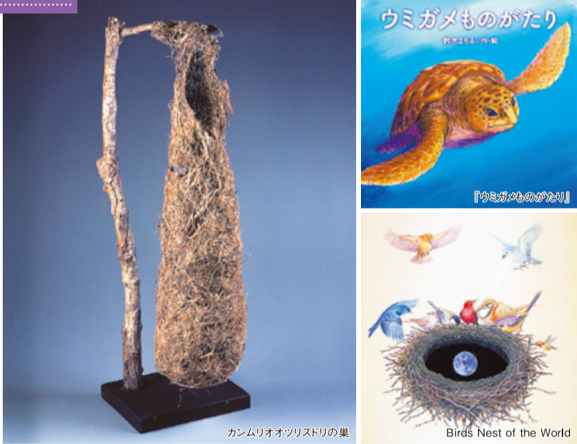
カンムリオオツリスドリの巣