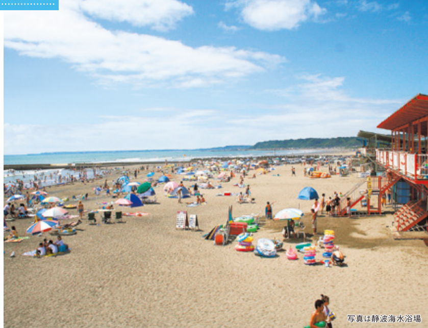
写真は静波海水浴場