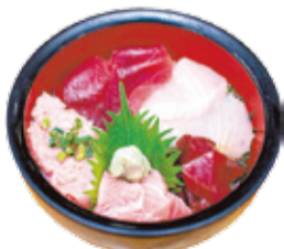
「5色上まぐろ丼」1,500円 (カニ汁付き)