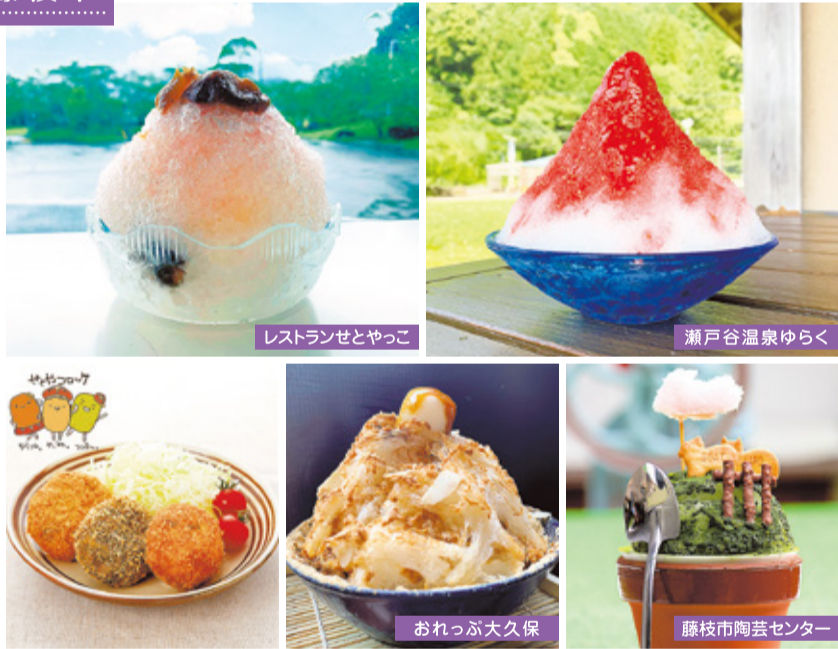
レストランせとやっこ