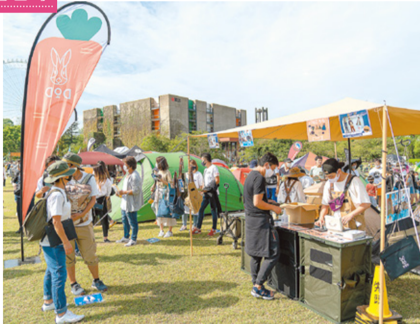
写真は毎年大阪で開催されているOUTDOOR PARK