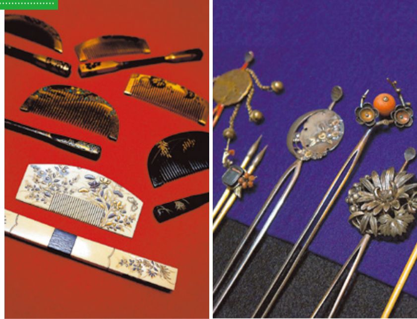
左:櫛笄(くしこうがい)各種 右:かんざし各種(島田市博物館蔵)