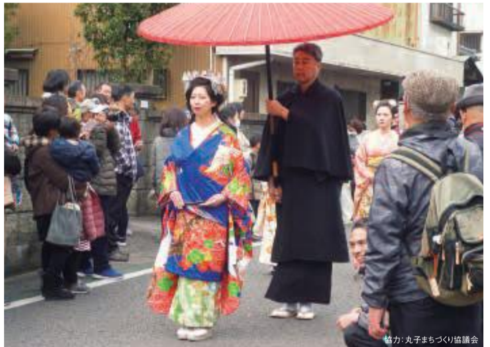
協力: 丸子まちづくり協議会