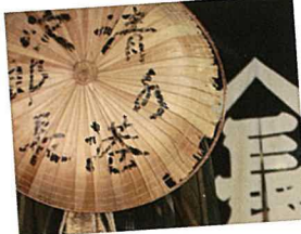
次郎長通り商店街は風情たっぷり。次郎長を身近に感じては？