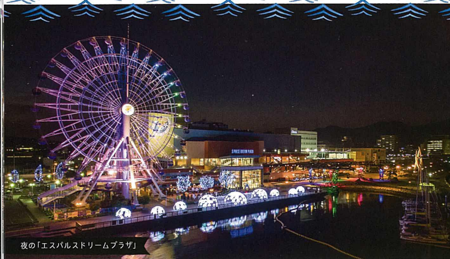
夜の「エスパルスドリームプラザ」