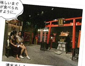
清水すしミュージアムで寿司の歴史と文化を学ぶ