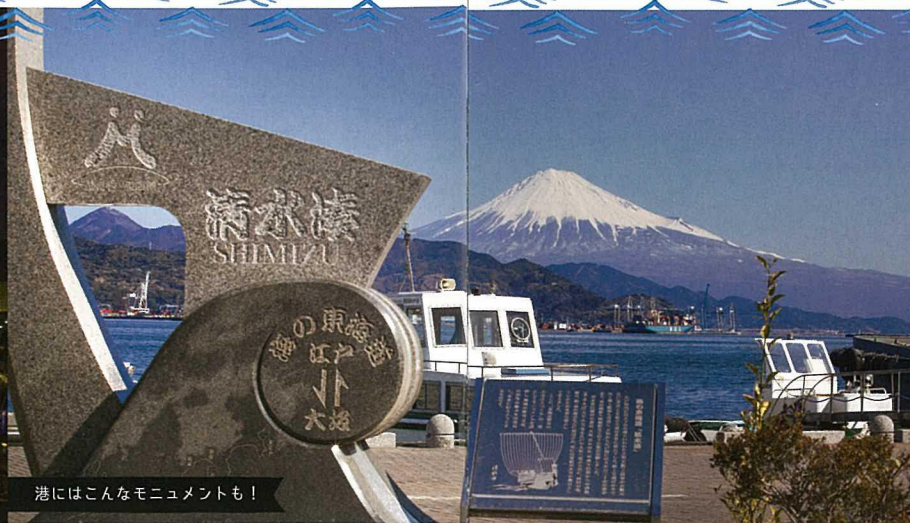
港にはこんなモニュメントも！