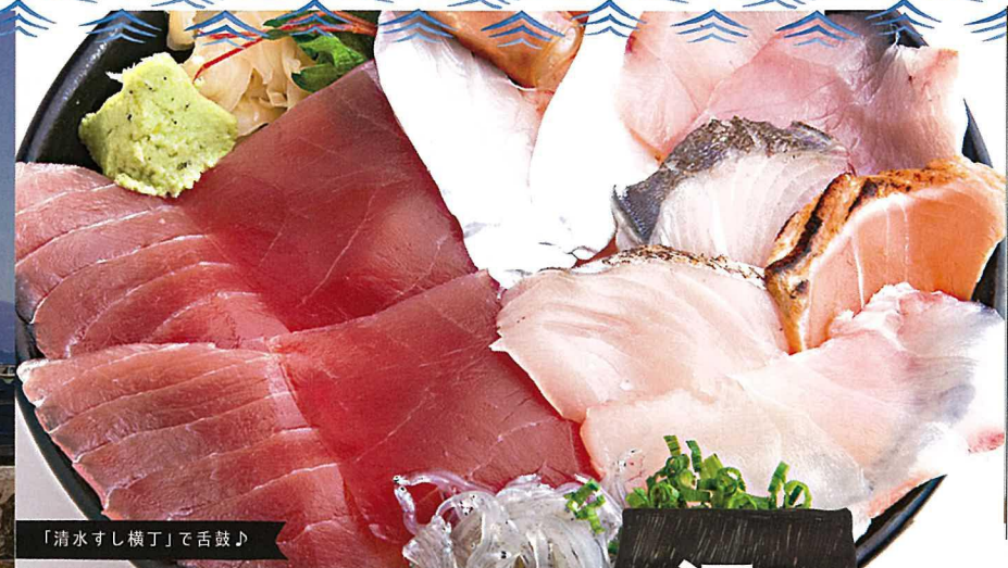
「清水すし横丁」で舌鼓♪