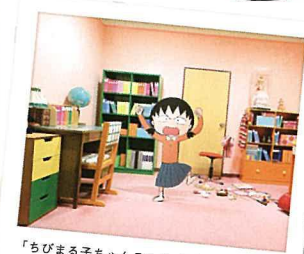
「ちびまる子ちゃんランド」は撮影スポットがたくさん。アニメの世界に浸ろう！