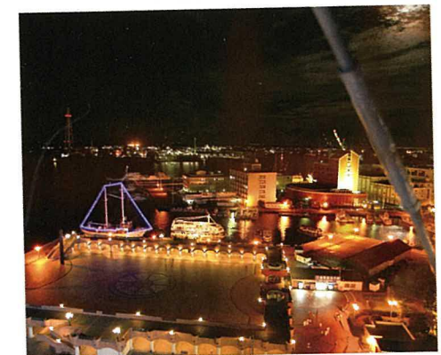
オススメ! PHOTO SPOT 港町ならではの夜景は、世界中の港町とつながっているロマンを感じますよね。ディナーが終わったら、潮風を感じながらお散歩しましょう