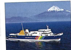
清水-土肥間を70分で結ぶ駿河湾フェリー船上から望む富士山はインスタ映え！