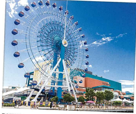
最高到達地点52mという大きな観覧車は、清水港が一望できる絶景を楽しむ。夜になるとライトアップしてまた違った雰囲気